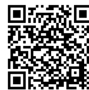
厚木市まち美化パートナー制度

【湘北のクリーンキャンペーンとは】1999年から続く、本厚木駅から大学までの通学路を清掃するボランティア活動です。学生や教職員が気軽に参加できる地域貢献イベントとして、5月と11月の年2回実施しています。