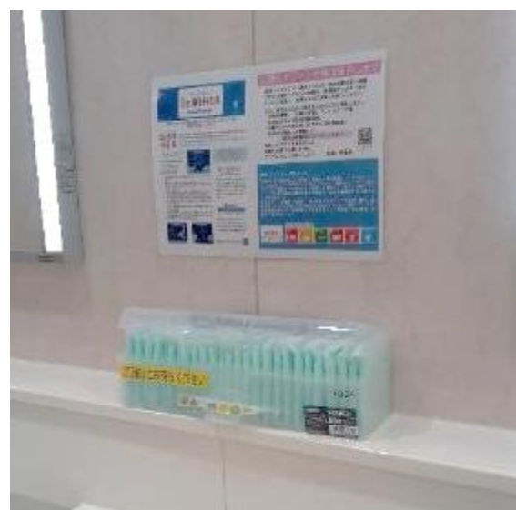
学内の女子トイレ11箇所に設置